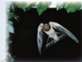
Hirondelle rustique Iroda d'estable

Les « temps forts » sont principalement marqués par le « retour » des Milans noirs, dès le début du mois de mars, des hirondelles (fin mars et avril) puis des Martinets noirs et des Bondrées apivores au mois de mai.