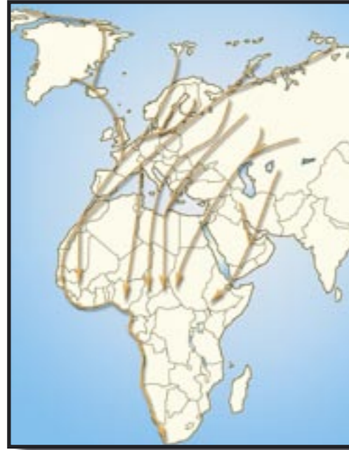
Principales voies de migration du Paléarctique occidental (d'après ALBOUY et al., 1997)

Cet incroyable périple n'est cependant pas sans danger. Nombre de migrateurs périssent lors du voyage, notamment en traversant la Méditerranée et le Sahara, victimes d'épuisement, du mauvais temps, de la chasse ou des prédateurs.