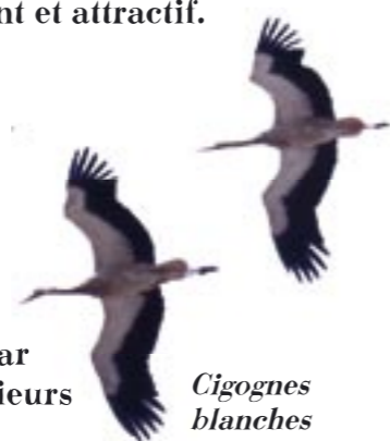
Cigognes blanches Cigonha comuna

Des passages relativement importants ont aussi été notés dans les Avants-Monts et les Monts d'Orb, notamment au printemps. Ils concernent surtout des passereaux (Pinson des arbres, alouettes, hirondelles...).