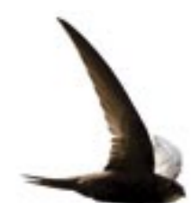
Martinet noir Faucilh

Près de 80 espèces d'oiseaux ont été observées en migration dans le Haut-Languedoc au cours de l'étude. Certaines d'entre elles sont rares et menacées en France et en Europe comme la Cigogne noire, le Balbuzard pêcheur, le Milan royal, l'Hirondelle rousseline ou les Vautours fauve et pernoptère.