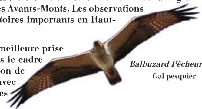
Balbuzard Pêcheur Gal pesquièr

Ces informations sont également précieuses pour une meilleure prise en compte des couloirs de migration des oiseaux, dans le cadre des réflexions menées autour des projets d'implantation de parcs éoliens. En effet, il existe un risque de collision avec les éoliennes (mâts et pales) qui sont autant d'obstacles pour les oiseaux.