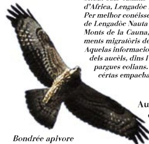
Bondrée apivore Vespatiera

Situat suls camins de passa de fôrça d'aucèls migradors venguts d'Euròpa del Nòrd o arribant d'Àfrica, Lengadòc Naut es lo lòc, d'òs cops per an, d'un espectacle aerian reirable. Per melhor conèisser l'importància e lo debanament d'aquel fenomèn, lo Pargue Natural Regional de Lengadòc Naut a fach amb la L.P.O. Tarn, lo G.R.I.V.E. e l'O.N.C.F.S., un seguit de la passa als Monts de la Cauna, Montanha Negra e als Avants-monts. Las observacions confirman de moviments migratoris dels pus bèls a Lengadòc Naut. Aquelas informacions son tanben preciosas per melhor téner compte de las passadas de migracion dels aucèls, dins l'encastre de soscadissas menadas a l'entorn dels projèctes d'implantament de pargues eolians. Que pòd existír lo risc de tust amb las eolianas (pals e alas), que representan cèrtas empachas pels aucèls.