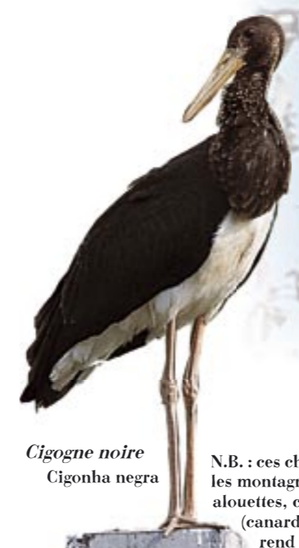
Cigogne noire Cigonha negra