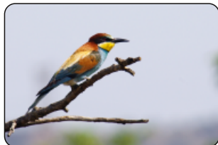
Guépier d'Europe