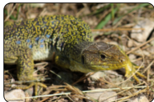
Lézard ocellé