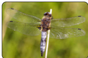
Libellula fulva