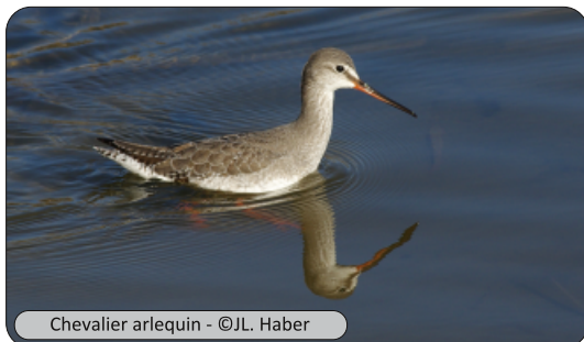
Chevalier arlequin