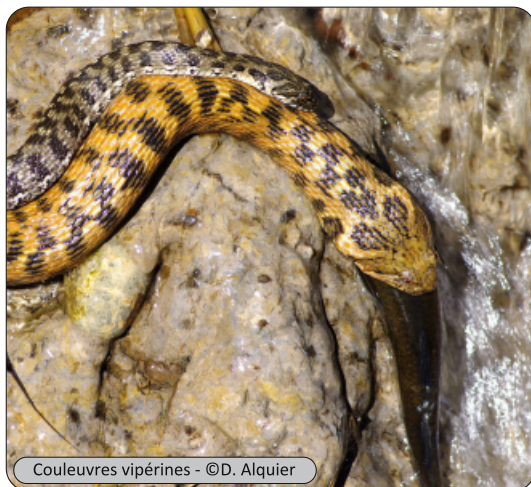
Couleuvres vipérines