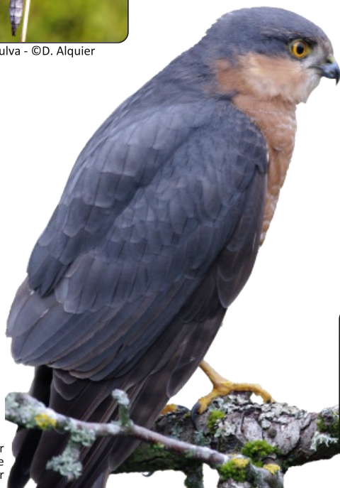
Epervier d'Europe