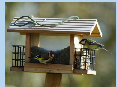
Chardonneret élégant et Mésange charbonnière