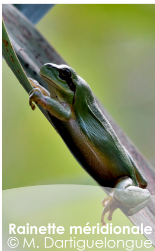
Rainette méridionale © M. Dartiguelongue