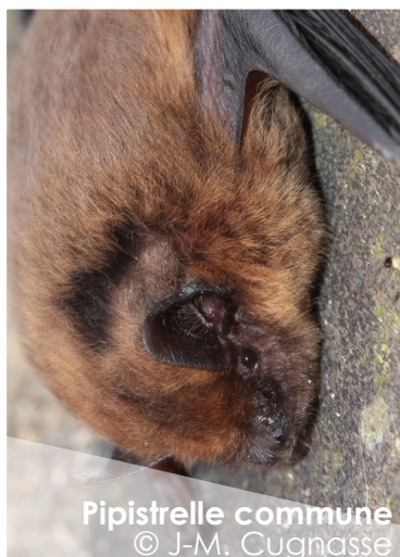
Pipistrelle commune