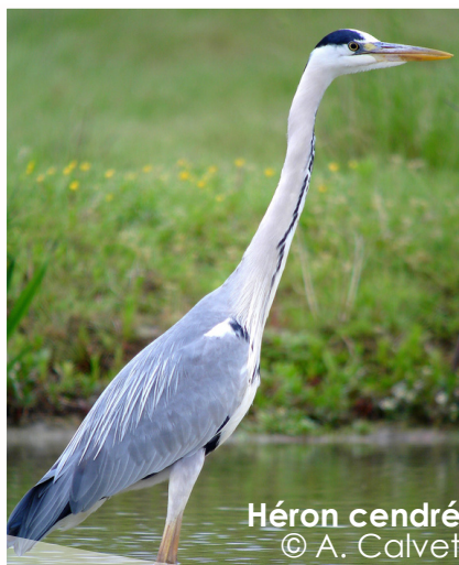
Héron cendré