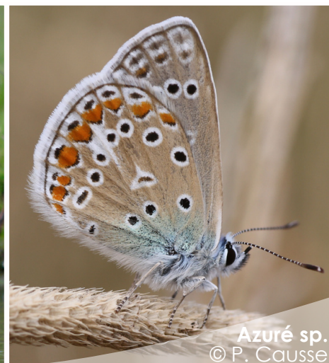
Azuré sp.