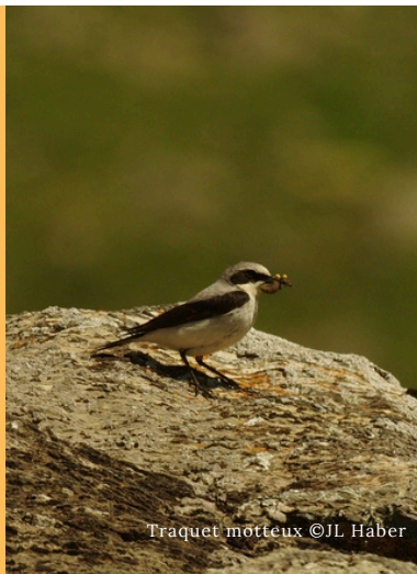
Traquet motté

En ce début du mois d'octobre, la chute des feuilles est synonyme d'importants mouvements migratoires au sein de l'avifaune. Selon les études, 2.1 milliards de passereaux et assimilés transiteraient entre l'Europe et l'Afrique subsaharienne en survolant des barrières écologiques majeures telles que la mer Méditerranée ou le désert du Sahara, vaste étendue aride de plus de 2000 km de large. Les stratégies de vol des différentes espèces, jusqu'à présent peu documentées, bénéficient désormais d'une meilleure compréhension depuis le développement de nouveaux dispositifs de suivi.