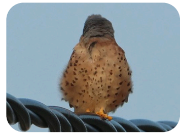
Réponse: Faucon crécerellette

Nos amis les oiseaux sont rapides et furtifs. Bien souvent, nous ne retenons de ces rencontres qu'une silhouette ou un détail de l'individu. Amusons-nous à les identifier à partir d'une photo !