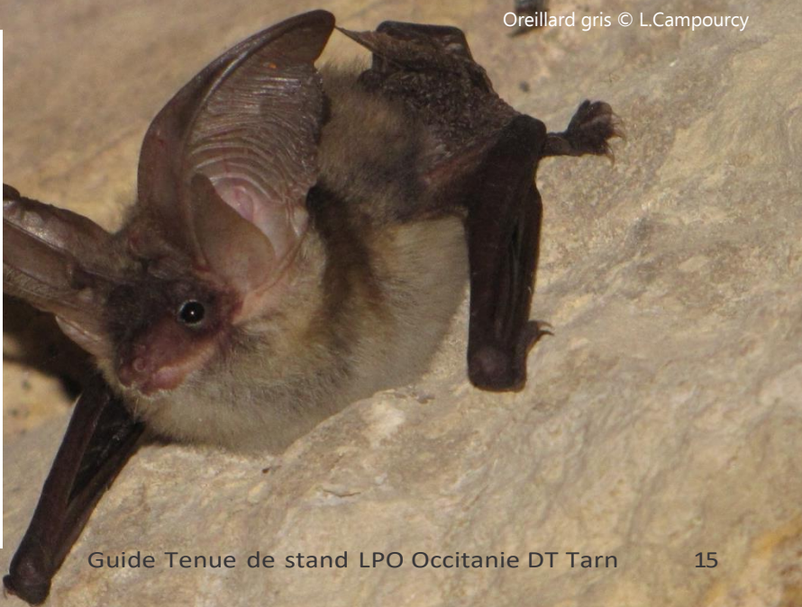
Oreillard gris