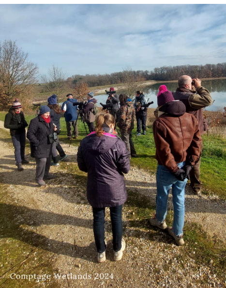
Comptage Wetlands 2024

Si vous souhaitez participer au comptage des canards, limicoles et autres grèbes le 11/01 à 9h00 à la Réserve Naturelle Régionale de Cambounet-sur-le Sor (Saïx 81), contactez animation.tarn@lpo.fr