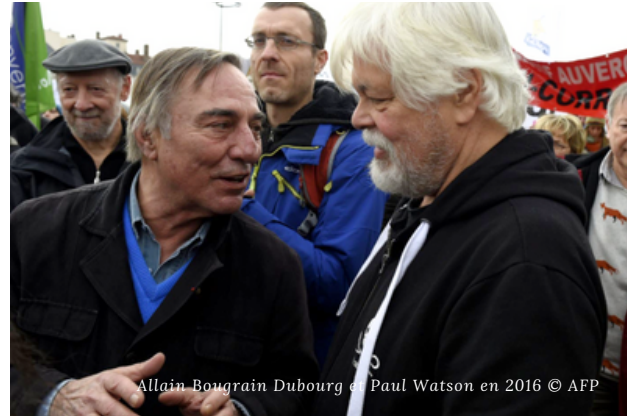
Allain Bougrain Dubourg et Paul Watson en 2016

La justice danoise a annoncé le 17 décembre 2024 la remise en liberté de Paul Watson, arrêté en juillet dernier lors d'une escale au Groenland, à la demande du Japon qui lui reprochait de s'être opposé à des baleiniers nippons dans une zone pourtant protégée en Antarctique, et demandait son extradition. L'arrestation du fondateur de l'ONG Sea Shepherd avait suscité une vague d'indignation et une importante mobilisation internationale pour sa libération, notamment en France où il réside.