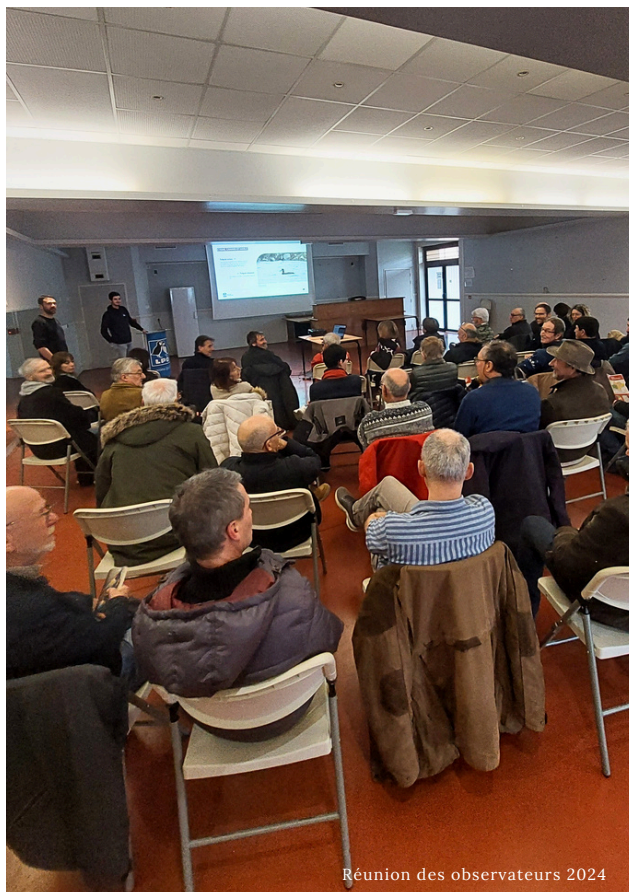
Réunion des observateurs 2024

Cette année, la réunion des observateurs se déplace dans le nord-ouest du Tarn, à Salvagnac !