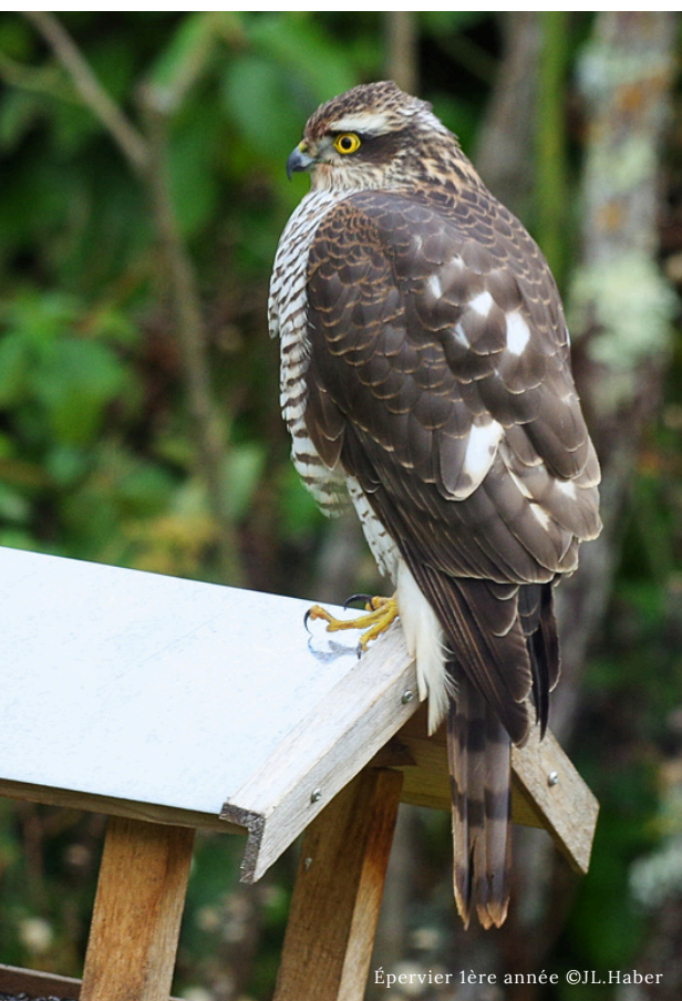
Épervier 1ère année