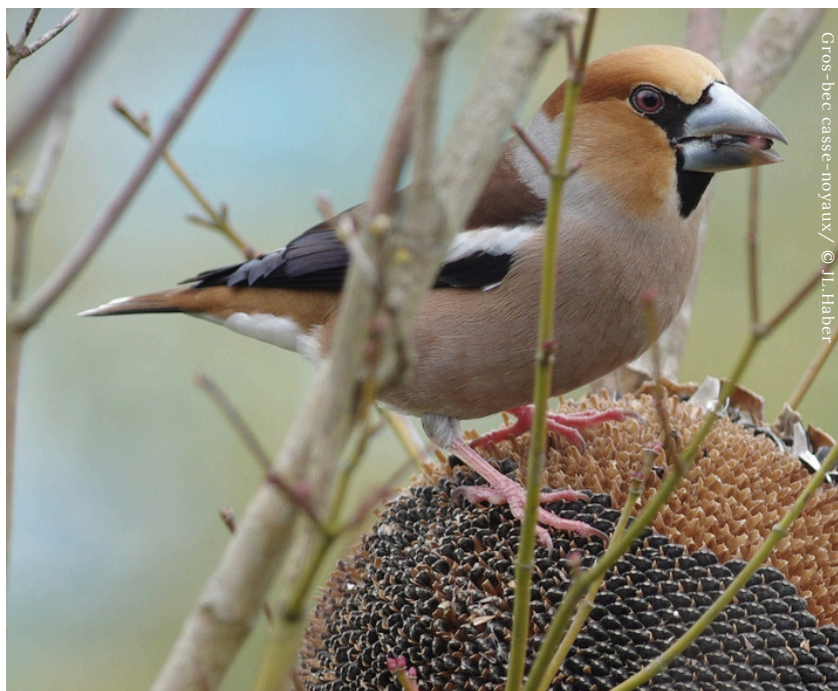
Gros-bec casse-noyaux

Elle aura lieu le samedi 1er février à Réalmont (81) (Un seul lieu de la distribution).