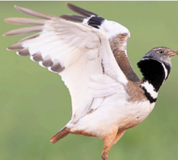
Otarde cenerpetière

Pour lire la suite de l'article, cliquez ICI.