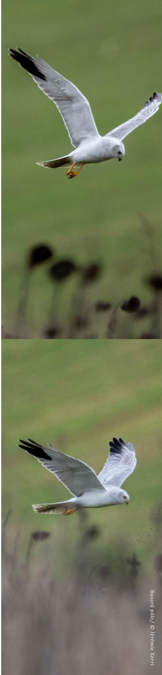
Busard pâle

Merci aux rédacteurs de l'article sur le Busard pâle dans la revue Post-Ornithos.