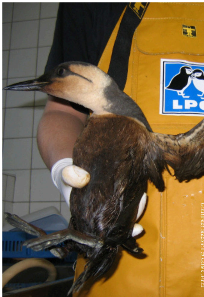
Guillemot mazouté

Pour consulter l'article complet, cliquez ICI.