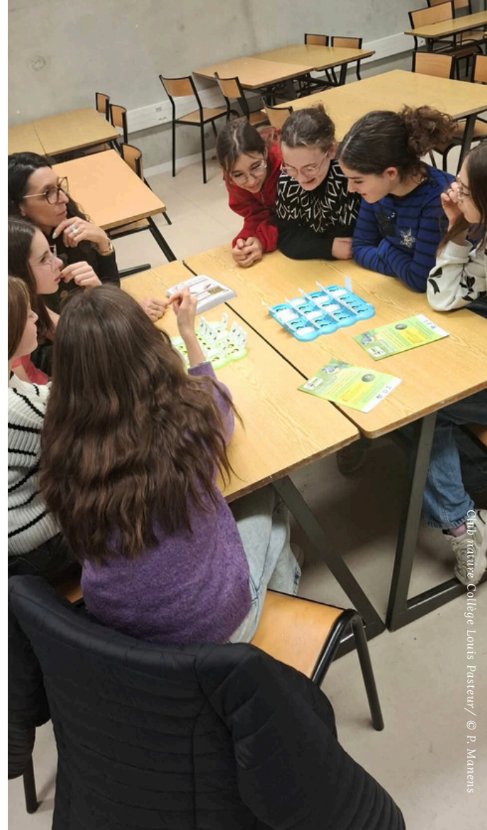
Club nature Collège Louis Pasteur

Ces deux séances constituent une première étape avant de nombreuses actions à venir : installations de nichoirs, aménagements favorables à la faune, observations régulières... Autant de projets portés avec enthousiasme par le Club nature, pour faire du collège un Refuge LPO vivant et engagé .