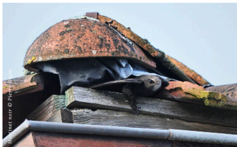
Martinot noir

La première étape de toute politique ambitieuse en faveur de la biodiversité repose sur la connaissance. De nombreuses collectivités s'engagent aujourd'hui dans la réalisation d'inventaires de la faune et de la flore à travers des Atlas de la biodiversité communale. Ces démarches, souvent participatives, associent les habitants à l'observation de leur environnement et permettent de mieux identifier les richesses naturelles locales, ainsi que les enjeux de leur préservation.