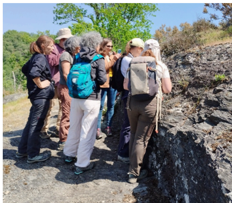
Observations et photographies d'un Lézard catalan téméraire ©Sébastien ALBINET

Nous observerons deux autres Lézards ocellés, dont un à quelques mètres, ainsi que de nombreux Lézards catalans et une Couleuvre vipérine, au niveau de la presqu'île d'Ambialet. A notre connaissance, il s'agit de la première fois que quatre Lézards ocellés sont observés au cours d'une même journée dans le Tarn.