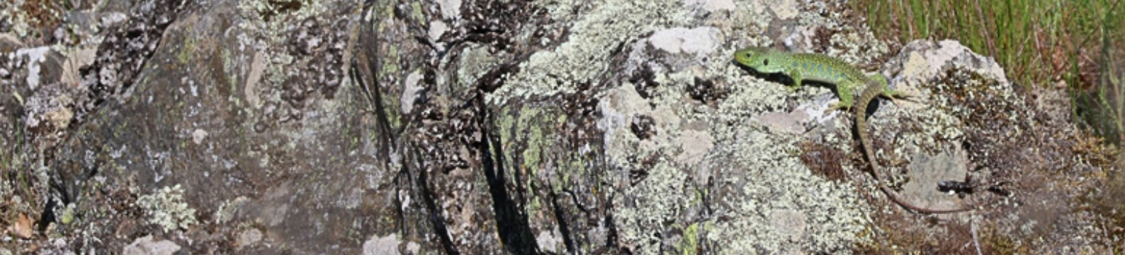
Mâle adulte, observé à Courris, le 24/04/2026.