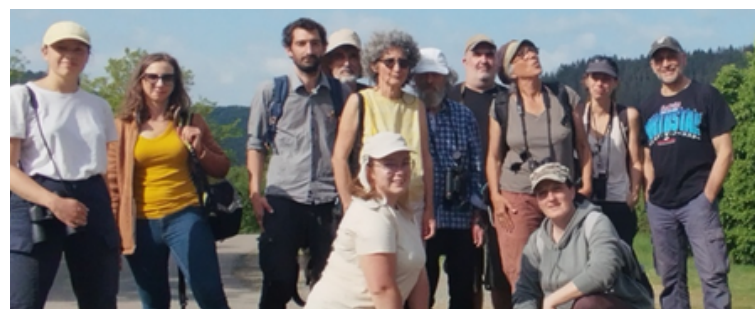
L'équipe de choc de la journée.