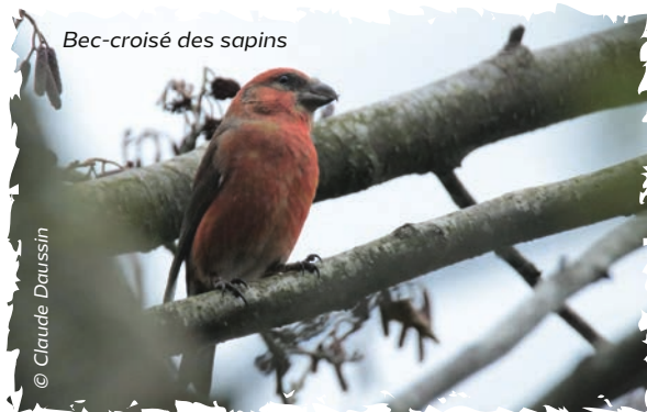
Bec-croisé des sapins

> Chantal Segui ✉️ lpo31.inscriptions@gmail.com