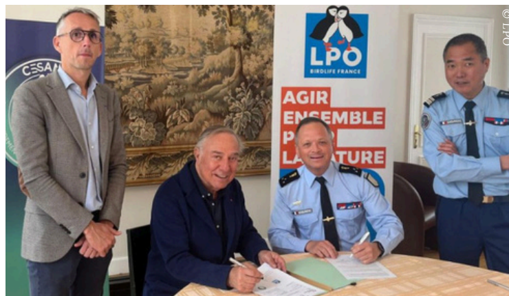
Signature de la convention de partenariat entre la Gendarmerie nationale et la LPO le 20 mai 2026 à Paris.

“À l’heure où le recul de la biodiversité s’accélère, protéger la faune sauvage impose de mieux prévenir, mieux enquêter et mieux coopérer. Cette convention traduit une volonté commune d’unir nos expertises pour renforcer concrètement la protection du vivant”. Allain Bougrain Dubourg, président de la LPO